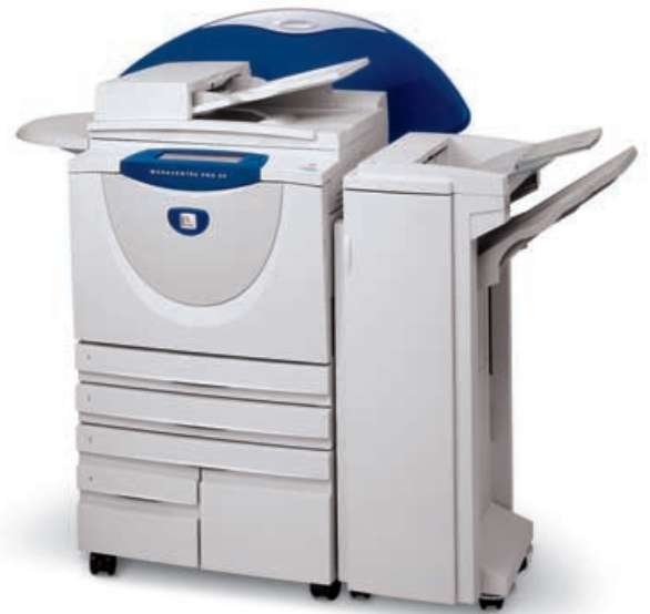
WorkCentre Pro 55 con módulo de acabado para oficina opcional.

Ofrece un cómodo acceso a funciones avanzadas opcionales como el escaneado a través de la red, envío de fax y correo electrónico.