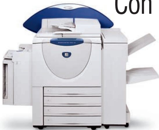
WorkCentre Pro 65 con alimentador de gran capacidad para 3100 hojas opcional y módulo de acabado para oficina

Presentamos los nuevos sistemas multifunción avanzados WorkCentre® Pro 65/75/90 de Xerox. Se trata de una gama de potentes dispositivos que ayudan a producir más y mejor que nunca.