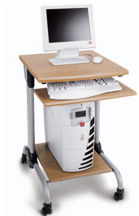
Servidor de color para red EFI Fieri EX3535 con soporte de servidor opcional.